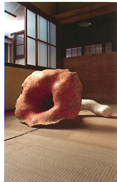
「絵画の庭-短蛇花」 木材、顔料、アクリル絵具